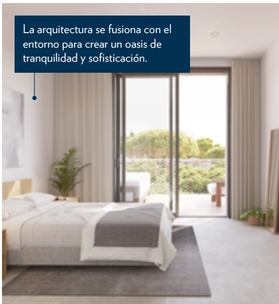
La arquitectura se fusiona con el entorno para crear un oasis de tranquilidad y sofisticación.