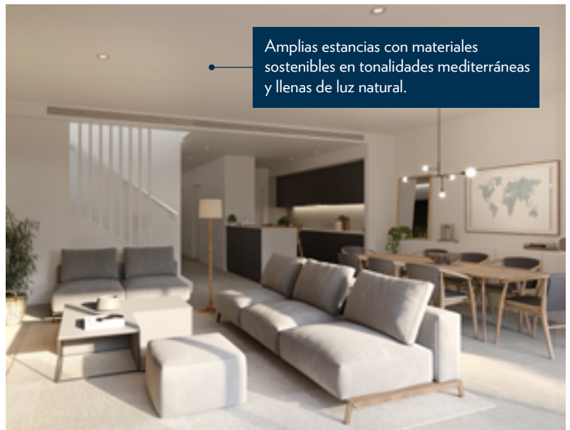
Amplias estancias con materiales sostenibles en tonalidades mediterráneas y llenas de luz natural.