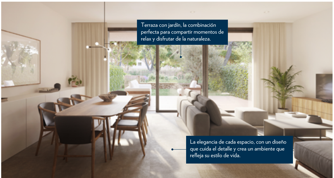
Terraza con jardín, la combinación perfecta para compartir momentos de relax y disfrutar de la naturaleza.