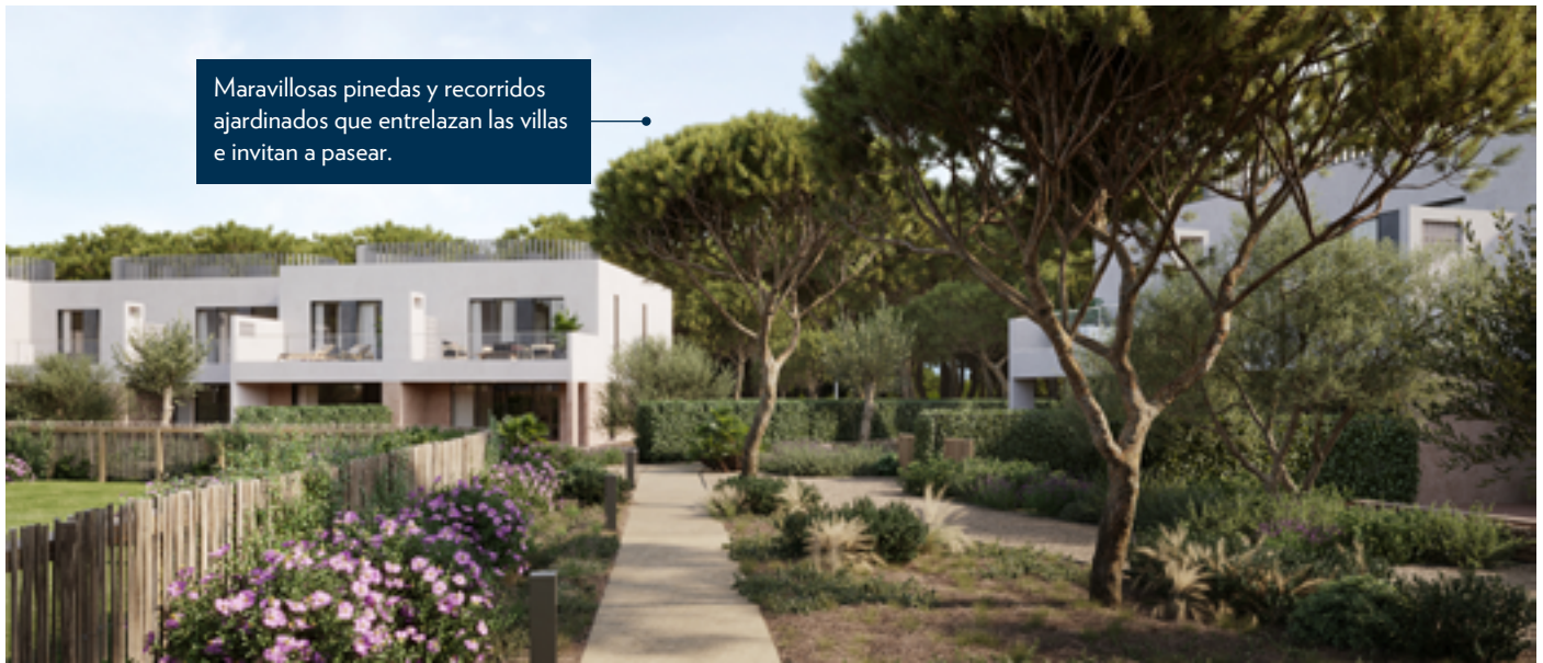
Maravillosas pinedas y recorridos ajardinados que entrelazan las villas e invitan a pasear.